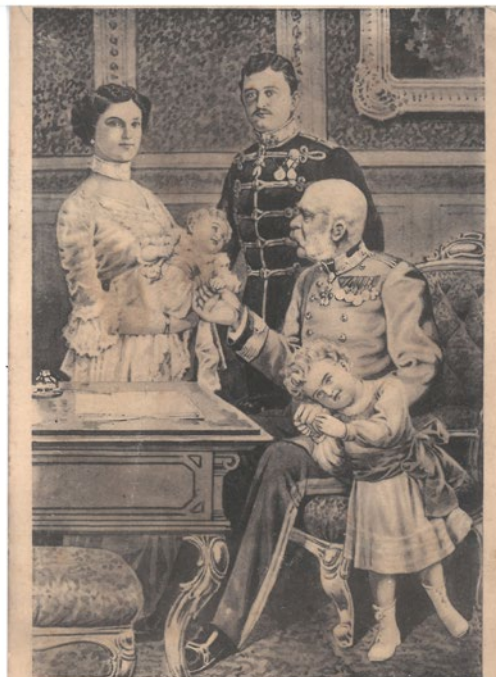
Ein entzückendes Familienbild des Allerhöchsten Kaiserhauses.

Karl war ein Großneffe von Franz Joseph. Nach dem Attentat von Sarajevo stieg er zum Thronfolger auf und wurde nach Kaiser Franz Josephs Tod im November 1916 neuer Kaiser von Österreich und König von Ungarn.