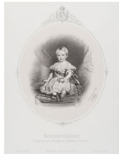
Abb. 2: Erzherzog Rudolf, Kronprinz und Thronfolger des Kaiserthums Österreich". Lithografie von Adolf Dauthage, 1860.

Rudolf Franz Karl Joseph wurde am 21. August 1858 im Schloss Laxenburg geboren. Seine Eltern waren Kaiser Franz Joseph (1830 – 1916) und Kaiserin Elisabeth, genannt Sisi (1837 – 1898). Rudolf hatte zur Zeit seiner Geburt eine zwei Jahre ältere Schwester, Gisela.