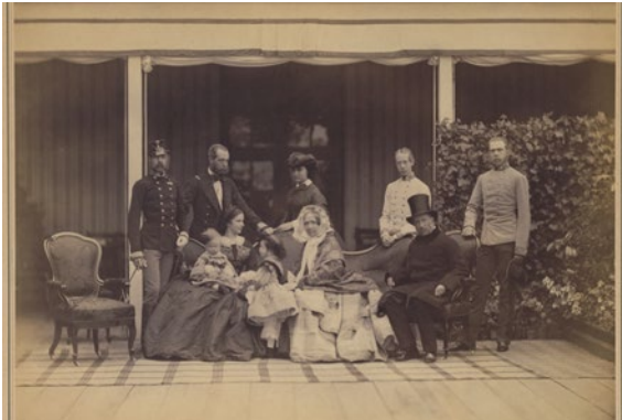
Abb. 7: Die kaiserliche Familie auf der Terrasse des Schlosses Schönbrunn. Fotografie von Ludwig Angerer, 1859.

Zu seinem Vater Kaiser Franz Joseph hatte Rudolf ein schwieriges Verhältnis. Vater und Sohn vertraten unterschiedliche politische Positionen.