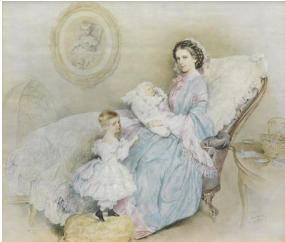
Abb. 1: Kaiserin Elisabeth mit Gisela und Rudolf, Aquarell von Joseph Kriehuber, 1858.

Rudolf Franz Karl Joseph wurde am 21. August 1858 im Schloss Laxenburg geboren. Seine Eltern waren Kaiser Franz Joseph (1830 – 1916) und Kaiserin Elisabeth, genannt Sisi (1837 – 1898). Rudolf hatte zur Zeit seiner Geburt eine zwei Jahre ältere Schwester, Gisela.