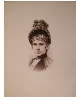
Abb. 9: Erzherzogin Gisela, Lithografie, 19. Jh.