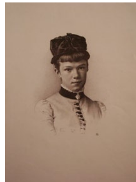
Abb. 8: Erzherzogin Marie Valerie, Lithografie, 19. Jh.

Er war eifersüchtig auf seine um 10 Jahre jüngere Schwester Marie Valerie , da sich die Kaiserin Elisabeth sehr viel um sie kümmerte.