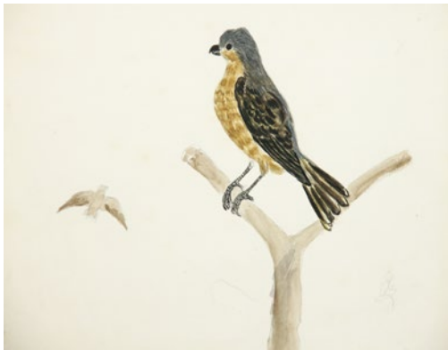
Abb. 12: Sperber auf einem Ast sitzend und fliegender, unbestimmbarer kleiner Vogel. Eigenhändige aquarellierte Zeichnung von Kronprinz Rudolf, um 1868.

Kronprinz Rudolf interessierte sich schon als Kind für die Vogelkunde (Ornithologie). In seinen Schreibheften finden sich selbstgezeichnete Abbildungen von Vögeln.