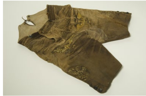
Abb. 11: Lederhose des Kronprinzen Rudolf, um 1880.

Bei der Jagd gab man sich volkstümlich und trug Lederhose und Lodenjanker.