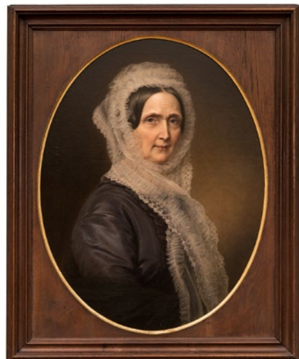
Abb. 3: Erzherzogin Sophie. Ölgemälde eines unbekanntenen Künstlers, um 1870.

Es war in Adelskreisen üblich, dass sich Personal um die Kinder kümmerte. So übernahm die „Kindsammer“ sofort nach der Geburt die Versorgung des Kindes inklusive Stillen, Wickeln und Füttern. Die kaiserlichen Eltern hatten viele Pflichten und mussten auch oft verreisen. Kronprinz Rudolf wuchs bis zum Alter von 6 Jahren mit seiner Schwester Gisela auf. Er hatte eine sehr enge Beziehung zu seiner Großmutter, Erzherzogin Sophie, ihr oblag auch die Aufsicht über die Erziehung.