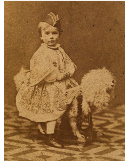
Abb. 4: Kronprinz Rudolf mit Plüschhund. Fotografie von Ludwig Angerer, 1860.