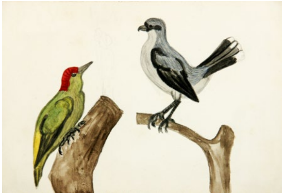
Abb. 5: Grünspecht mit Schwarzstirnwürger, jeweils auf einem Ast sitzend. Eigenhändige aquarellierte Zeichnung von Kronprinz Rudolf, um 1868.

Rudolf hätte gerne an der Universität studiert, aber es wurde ihm nicht erlaubt. In adeligen Kreisen galt ein Studium als nicht standesgemäß. Der Kronprinz sollte eine militärische Laufbahn einschlagen. Mit 30 Jahren wurde Rudolf zum „General-Infanterie-Inspektor“ ernannt. In dieser Funktion kontrollierte er die Kasernen der Monarchie. Wie sein Vater Kaiser Franz Joseph sah er die Armee als wichtigste Stütze der Monarchie.