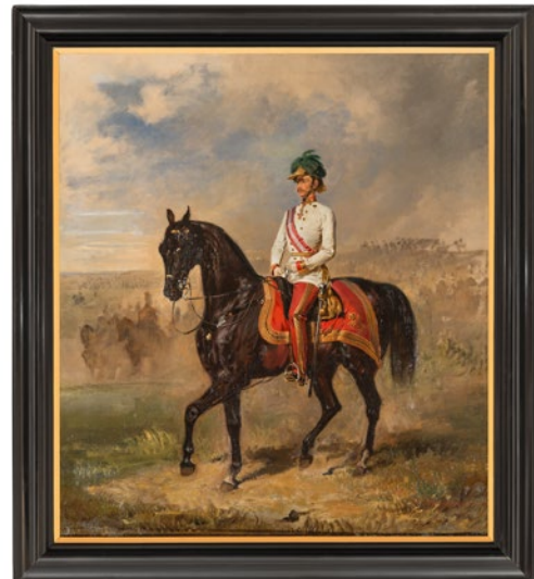
Abb. 6: Kaiser Franz Joseph zu Pferd in Feldmarschall-Galauniform mit dem Orden vom Goldenen Vlies.

Rudolf hätte gerne an der Universität studiert, aber es wurde ihm nicht erlaubt. In adeligen Kreisen galt ein Studium als nicht standesgemäß. Der Kronprinz sollte eine militärische Laufbahn einschlagen. Mit 30 Jahren wurde Rudolf zum „General-Infanterie-Inspektor“ ernannt. In dieser Funktion kontrollierte er die Kasernen der Monarchie. Wie sein Vater Kaiser Franz Joseph sah er die Armee als wichtigste Stütze der Monarchie.