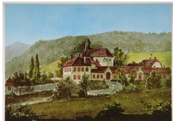
Abb. 15: Jagdschloss Mayerling des Kronprinzen Rudolf in Mayerling. Historische Postkarte, 20. Jh.

Kronprinz Rudolf wurde nur 30 Jahre alt.