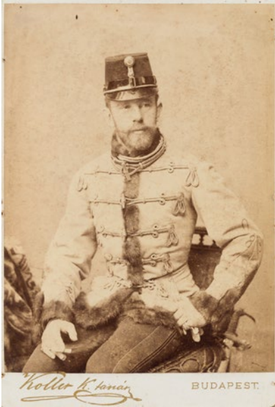
Abb. 14: Kronprinz Rudolf in Galauniform in ungarischer Adjustierung. Fotografie von Károly Koller, 1887.

Kronprinz Rudolf hatte mit vielen Problemen zu kämpfen: Er war am Wiener Hof ein Außenseiter und litt darunter, dass sein Vater Kaiser Franz Joseph seine Ideen ablehnte. Zwar sollte er später ein großes Reich beherrschen, durfte aber die Politik nicht mitbestimmen.