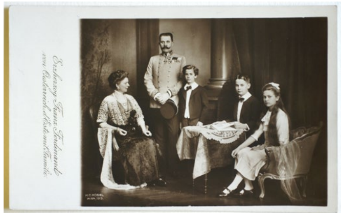
Abb. 16: Thronfolger Franz Ferdinand mit Gattin Sophie und Kindern. Postkarte nach einer Aufnahme des Atelier Adèle, vor 1914.

Der Thronfolger und seine Frau wurden am 28. Juni 1914 in Sarajevo ermordet. Kurz darauf brach der Erste Weltkrieg aus.