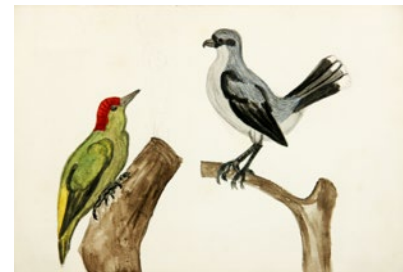
Abb. 2: Grünspecht mit Schwarzstirnwürger, jeweils auf einem Ast sitzend. Eigenhändige aquarellierte Zeichnung von Kronprinz Rudolf, um 1868.

Als Elisabeth nach ihren Auslandsaufenthalten nach Wien zurückkehrte, stellte sie ein Ultimatum („Ischler Ultimatum“, 1865): Entweder bestimme sie die weitere Erziehung oder sie verlasse den Hof. Jetzt wurden liberal eingestellte intellektuelle Persönlichkeiten und Wissenschaftler für den wissbegierigen Jungen prägend. Ein Studium, weil „unstandesgemäß“, war für den ehrgeizigen Rudolf allerdings verwehrt. Die Verleihung von Ehrendoktoraten sah er kritisch, er wollte nicht nur wegen seines Standes und Namens, sondern als denkende und forschende Persönlichkeit anerkannt werden.