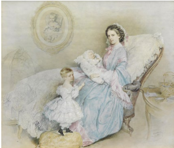
Abb. 1: Kaiserin Elisabeth mit Gisela und Rudolf, Aquarell von Joseph Kriehuber, 1858.