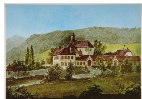
Abb. 6: Jagdschloss Mayerling des Kronprinzen Rudolf in Mayerling. Historische Postkarte, 20. Jh.