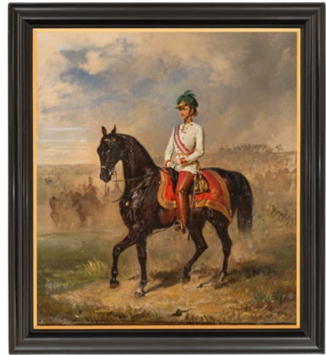
Abb. 4: Kaiser Franz Joseph zu Pferd in Feldmarschall-Galauniform mit dem Orden vom Goldenen Vlies.

Rudolf wurde in der Kapuzinergruft beigesetzt, an ihn erinnern heute Krankenhäuser in Wien (Rudolfstiftung, Rudolfinerhaus), ein Wiener Bezirk (Rudolfsheim-Fünfhaus), der Turkanasee (Ostafrika) hieß früher Rudolfsee; auch die Apfelsorte „Kronprinz Rudolf“ ist nach ihm benannt.