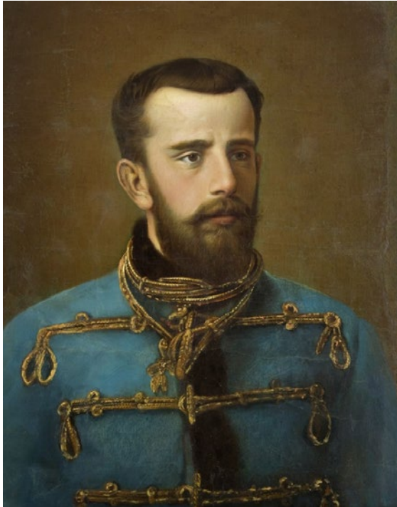
Abb. 7: Kronprinz Rudolf (Brustbildnis in Uniform) Ölgemälde eines unbekanntes Künstlers, nach 1888.