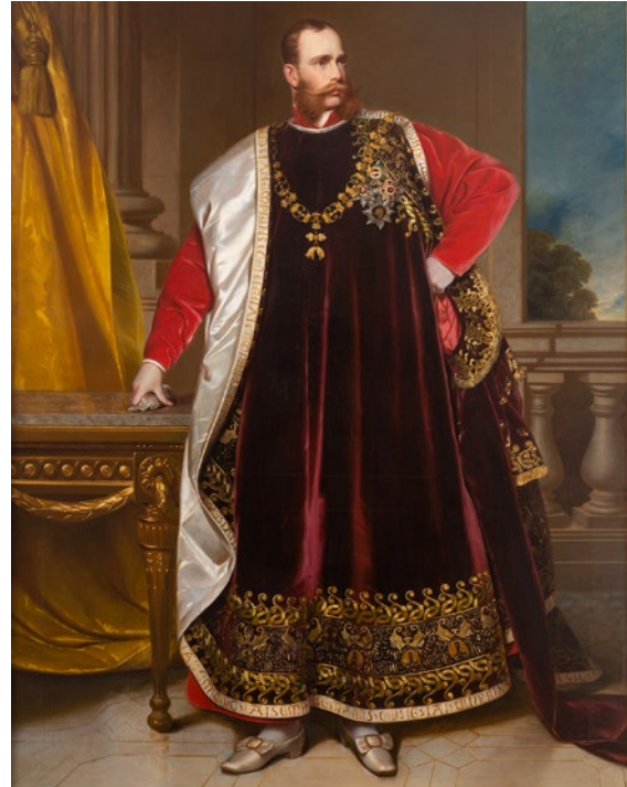
Abb. 8: Kaiser Franz Joseph im Ornat des Goldenen Vlieses. Ölgemälde von Josef Matthäus Aigner, 1868.

Kronprinz Rudolf hatte ein sehr angespanntes Verhältnis zu seinem Vater Kaiser Franz Joseph. Während dieser, wie der Großteil der einflussreichen Persönlichkeiten bei Hof, konservativ und autoritär eingestellt war, vertrat Rudolf sehr liberale Ansichten.